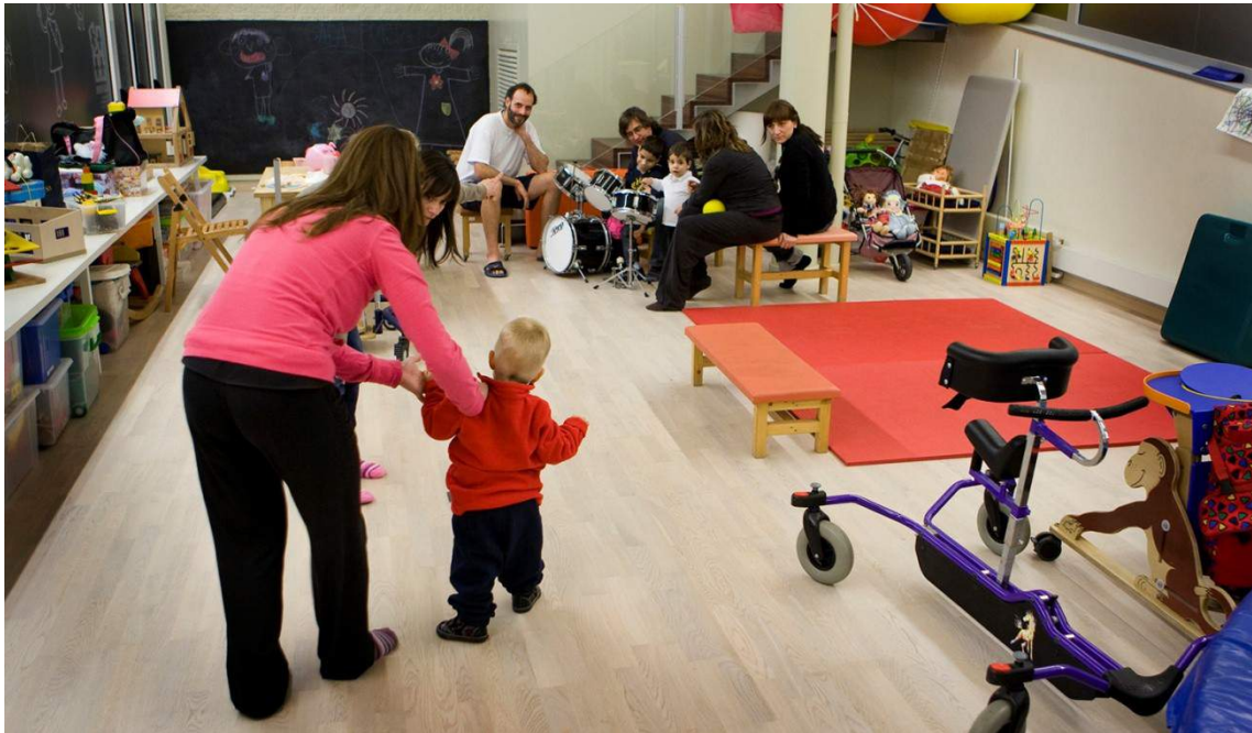
Escena del día a día de la Asociación Sala Puigverd, dedicada a la neurorehabilitación de niños y niñas.